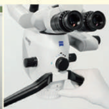
歯科用顕微鏡 マイクロスコープ