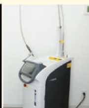
歯科用レーザー 治療・予防